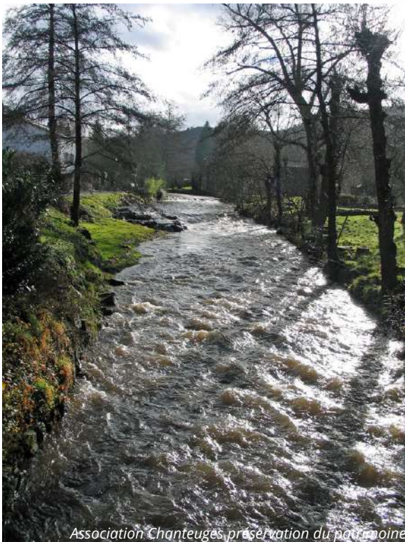
Association Chanteuges préservation du patrimoine