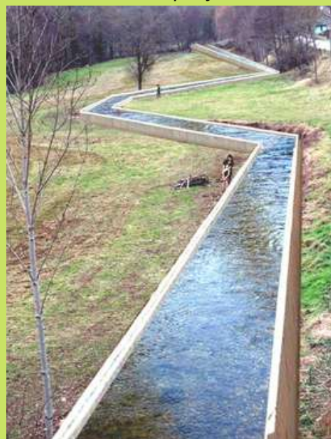
Le béal projeté

Association Chanteuges Préservation du Patrimoine