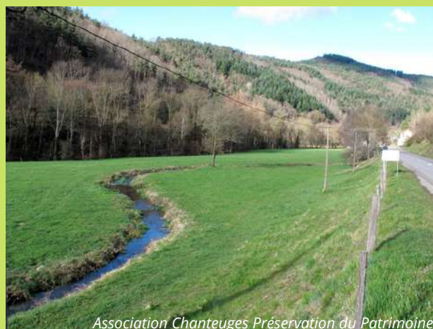
Le béal actuel

Association Chanteuges Préservation du Patrimoine