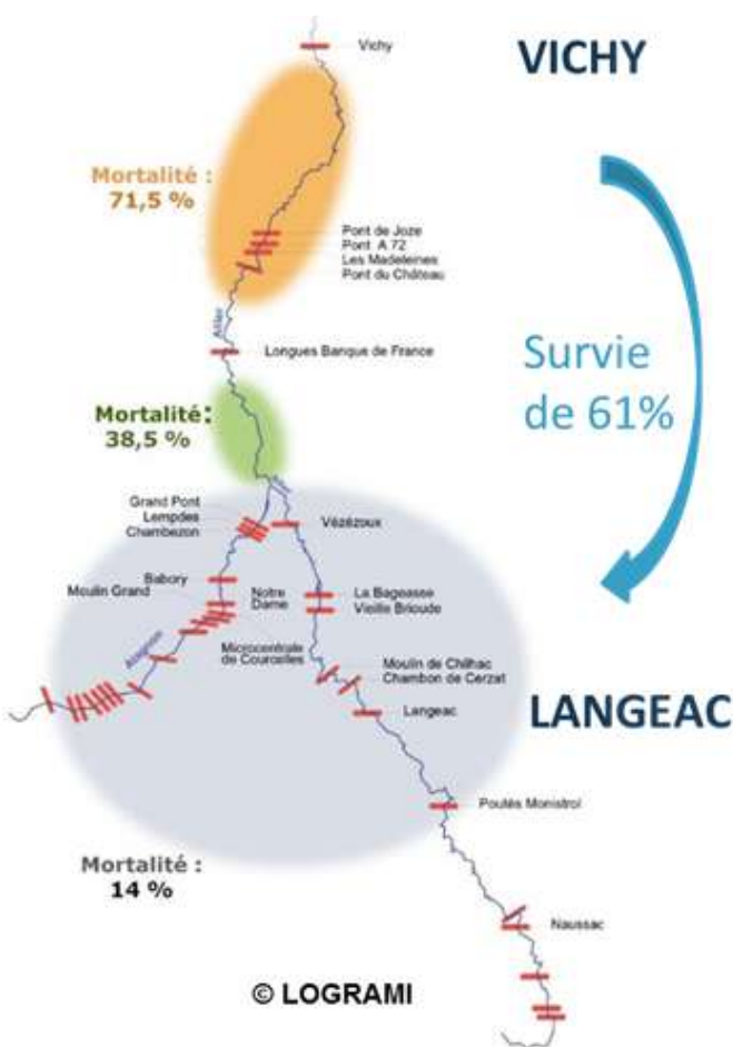
Carte des ouvrages de l'Allier de l'amont jusqu'à Vichy, Logrami 2009

Les études montrent une difficulté d'accès par les géniteurs aux meilleures zones de frayères à saumons, en amont de Vichy. Entre Vichy et Langeac, les impacts cumulés des ouvrages occasionnent 39 % de perte des géniteurs à la montaison, ainsi que 34 jours de retard migratoire (Logrami) .