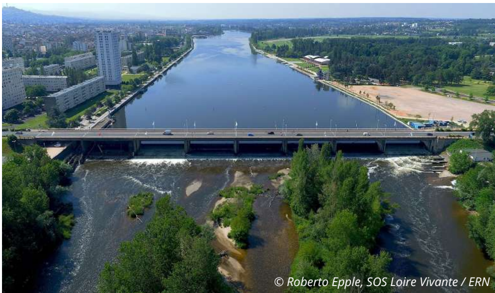
© Roberto Epple, SOS Loire Vivante / ERN