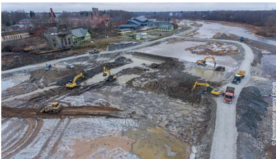
Effacement en cours du barrage Sindi, large de 151 mètres et haut de 4.5 mètres situé sur l'axe de migration du saumon, rivière Parnu en Estonie, décembre 2018.