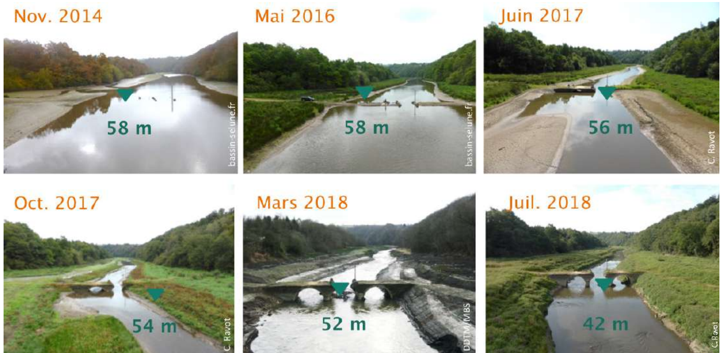
Figure 2. Évolution de la végétation au pont de la République (barrage de Vezins après exondation).

Le bassin de la Sélune, dont 77 % était jusqu'alors inaccessible, recèle des habitats historiquement très favorables aux espèces migratrices. Sur l'Oir, un affluent situé en aval des barrages, les scientifiques de l'Inra dénombrent ainsi chaque année les saumons, truites de mer et